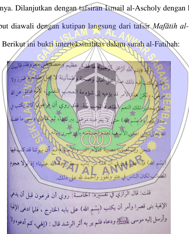
Gambar 1. 1 Safīnah Kallā Saya'lamūn fī Tafsīri Syaikhīnā Maimūn QS. Al-Fātihāh

al-Fatihah ayat 1 pada jilid pertama dalam kitab Safīnatu Kallā Saya'lamūn fī Tafsīri Syaikhīnā Maimūn ditemukan interteks mengenai hikmah lafal basmalah yang diceritakan dari kejadian Fir'aun yang memerintahkan untuk menulis lafal basmalah di atas pintu keluar istananya. 10 Tulisan basmalah memberikan efek penjagaan kepada Fir'aun sehingga tidak tertimpa sakit dan istananya menjadi tempat yang aman dan tentram. Hal ini dijelaskan oleh KH. Maimoen Zubair dalam tafsirnya. Dilanjutkan dengan tafsiran Ismail al-Ascholy dengan kode قلت tafsiran tersebut diawali dengan kutipan langsung dari tafsir Mafātih al-Ghayb karya al-Razi. Berikut ini bukti intertekstualitas dalam surah al-Fatihah: