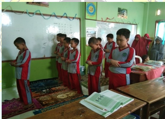
Gambar 6 Kegiatan Sholat Dhuhur Berjama'ah