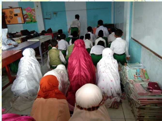
Gambar 8 Kegiatan Sholat Dhuha