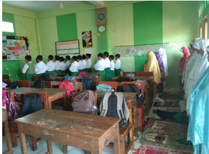
Gambar 7 Kegiatan Sholat Dhuha