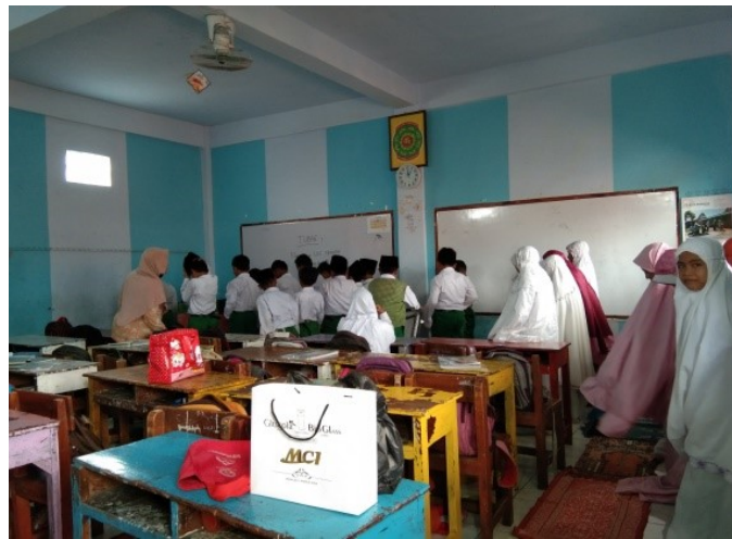
Gambar 5 Kegiatan Sholat Dhuhur Berjama'ah