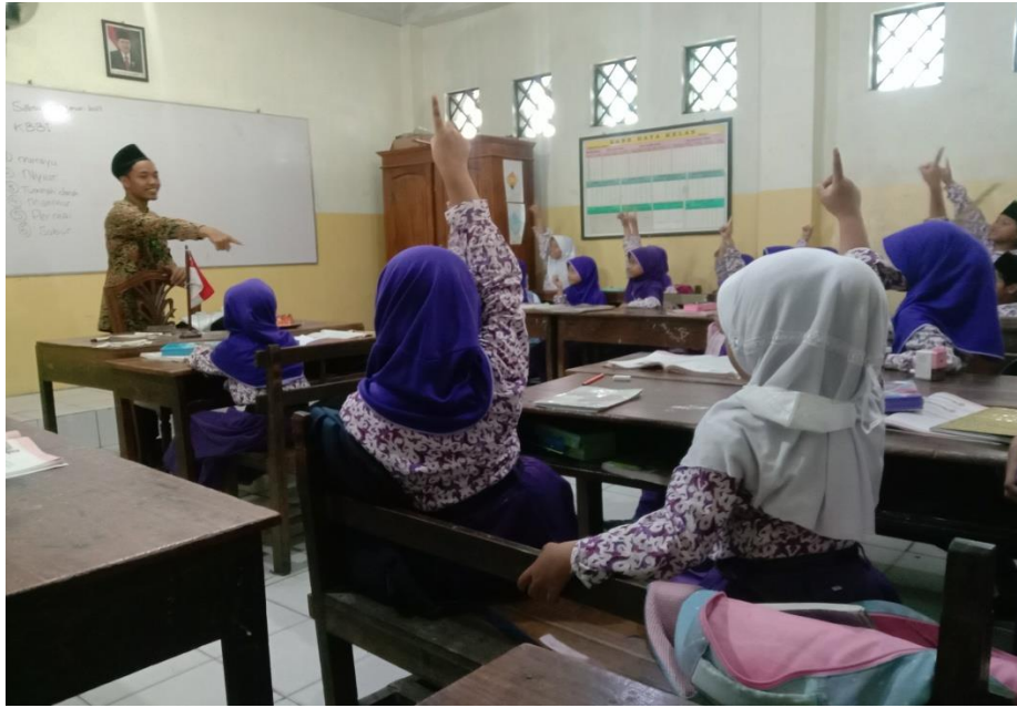
Proses Pembelajaran Tematik Kelas II A