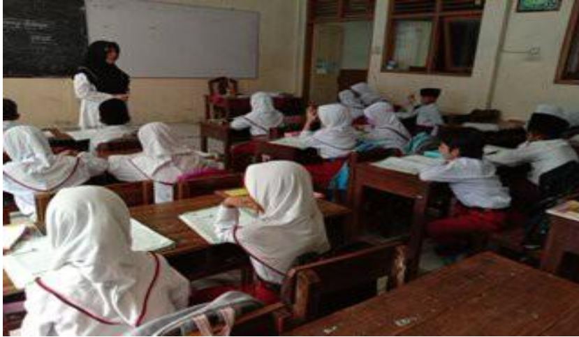
Proses Pembelajaran tematik siswa kelas II C