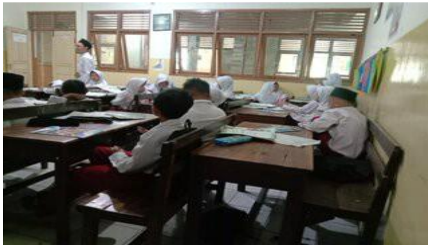
Proses pembelajaran tematik kelas II B