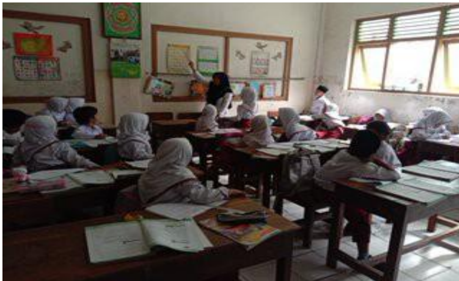
Memfaatkan media yang sesuai dengan materi yang tersedia di dalam kelas